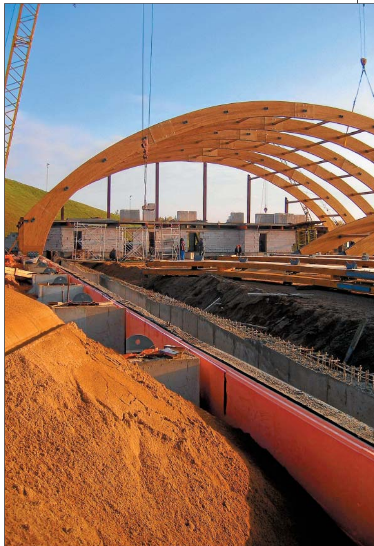
Монтаж теплоизоляционных матов приклеиванием с помощью битумно-каучуковой мастики (Крытый ледовый каток, горнолыжный курорт «Силичи»)